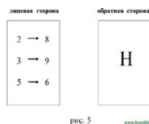
рис. 5 www.koolhaas.com

С этой целью используются индивидуальные карточки. Каждая карточка состоит из двух сторон — лицевой и обратной. На лицевой стороне указан ряд цифр в определенной последовательности (последовательность цифр должна соответствовать правилам графического изображения букв по элементам). На обратной стороне карточки дается образец буквы, которую ребенок выкладывал (его следует показывать только после выполнения задания) [1].