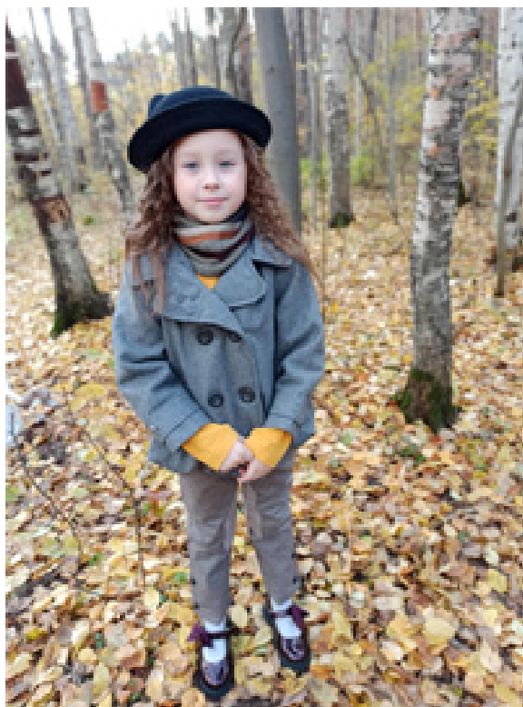
Фото работа «Красавица Осень»

КРОО ПСП «Дошкольник» г. Красноярск, ул. Академгородок 30-21, e-mail: doshkolnik@list.ru