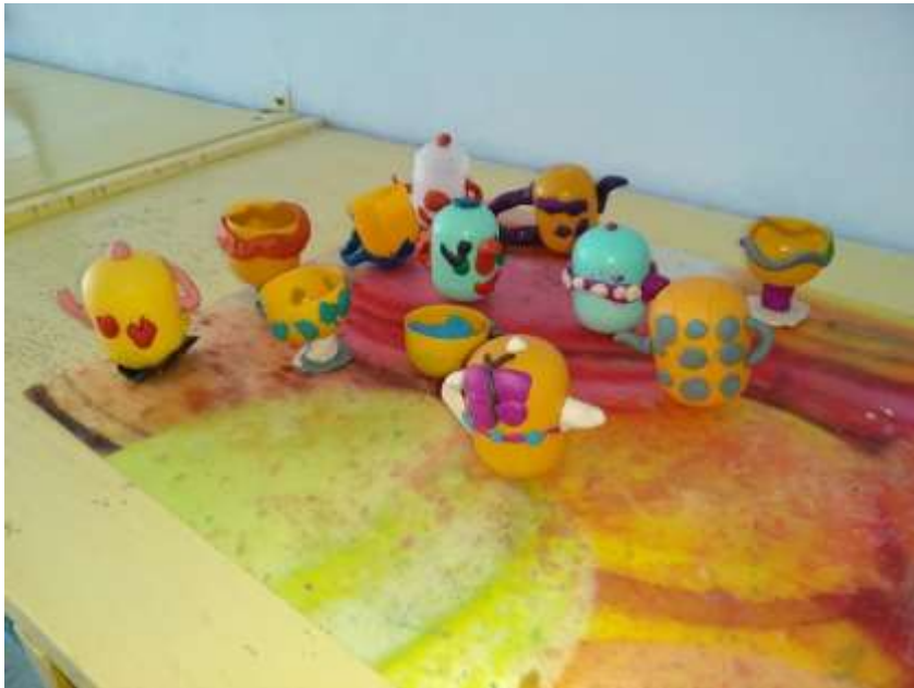
Столовые принадлежности из яичек от киндера и пластилина

Поделки, которые ребята сделали на конкурс так понравились всем остальным, что наша группа решила самим попробовать сделать что-нибудь из мусора, используя разные материалы. И вот что у нас получилось!