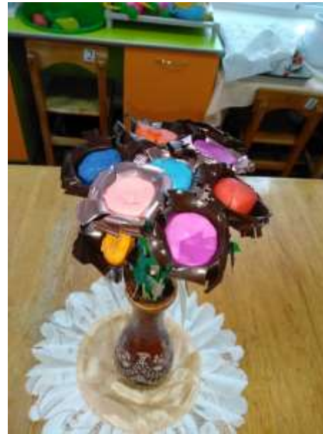
Всегда цветущий букет из пластилина, подставок из под конфет и цветной бумаги